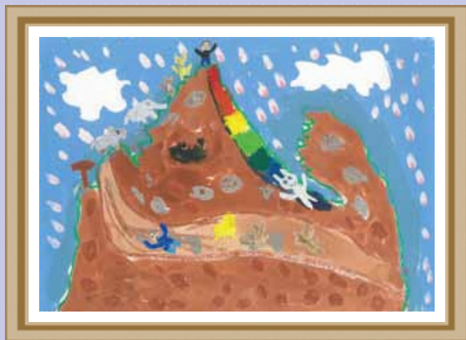
みんな楽しい動物の山 向台小学校 4年

図書館は、私の大きな本棚だと思っている。この本棚、非常に優秀で、絵本や小説はもちろん、二度は読まないなというベストセラー本や、自分では絶対に購入できない超高額な写真集、保存するスペースに悩む大型絵本、もう書店では手に入らない古い本、さらにはCDや、地域・行政の資料まである。しかも、これら全てが、自由にいつでも読める。何回でも読める。自宅でも読める。当然、無料！素晴らしい！趣味が読書の人間にとって、こんなに素敵なものはない。この「図書館」というシステムを考えた人は、きつと天才だ。