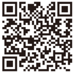
デジタル コレクション