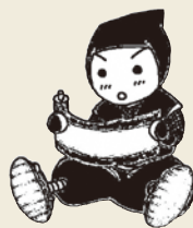
西東京市図書館キャラクター 西都右京くん

明治の末から大正時代にかけて、青梅街道の宿場町としての賑わいを残していた田無でしたが、鉄道が開通するまでの交通手段は、自転車の利用や、甲武鉄道(現中央線)武蔵境駅とを結ぶ乗合自動車を利用するしかありませんでした。