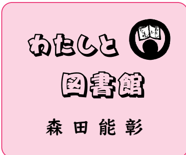
わたしと図書館 森田能彰

高野長英、小関三英、大蔵永常、藤信淵、江川英竜と鳥居耀蔵。事件後の彼らのスタンスのとり方を絞る、関連文献を追い続けました。文献が多く錯綜するのは避けられませんが、手がかりを求め我慢に我慢を重ねていると、わずかながら崋山像が少しずつ浮き彫りになってくるではありませんか。