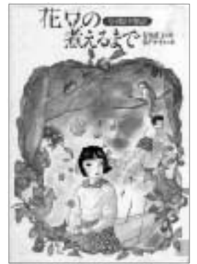
『花豆の煮えるまで―小夜の物語―』 作者：安房直子 画家：味戸ケイコ 偲成社

多くの児童向けのファンタジー作品を世に送り出した作家、安房直子さんが亡くなられてから今年で二十年になります。安房直子さんは、生前長く西東京市(旧保谷市)に暮らし、この地で執筆活動が続けていらっしやいました。当時の下保谷図書館に來館されたこともあったそうです。地域・行政資料室では、市に縁のある作家として安房直子さんの単行本や関連資料等を収集、保存しています。その中には、『花豆の会』(一九九〇年)、『二〇一二年。安房直子さんの作品を語り継ぐことを目的として(結成)から寄贈された貴重な資料もあります。